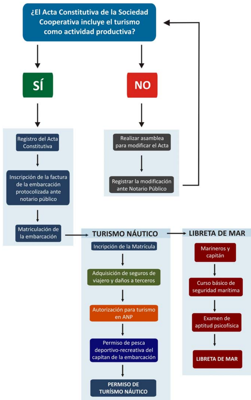
Diagrama de flujo sobre los pasos a seguir