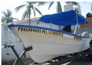
Fotografía a 45 grados